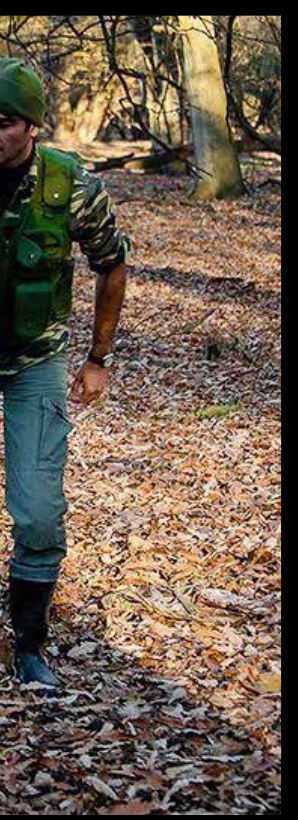
انتقال گوزن زرد از پناهگاه حیات وحش دشت ناز ساری

پیرمحمدی با اشاره به وجود اشتراک نامی که بین پیشرانه EFP و پیشرانه نسل قبلی EFV تصریح کرد: هیچ اشتراکی در بحث قطعات میان این دو پیشرانه وجود ندارد و اکثر قطعات EFVp کاملاً از لحاظ طراحی با پیشرانه EFV قدیمی متفاوت است.