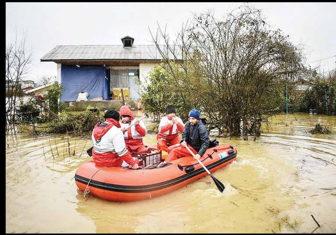
سیل و آبگرفتگی در پیربازار رشت

به‌گفته اینتراستار، همکاری این شرکت با تویوتا تلاشی برای پاسخگویی به افزایش تقاضا برای پرتاب ماهواره‌های کوچک است تا حضور ژاپن در صنعت فضایی پررنگ‌تر شود.