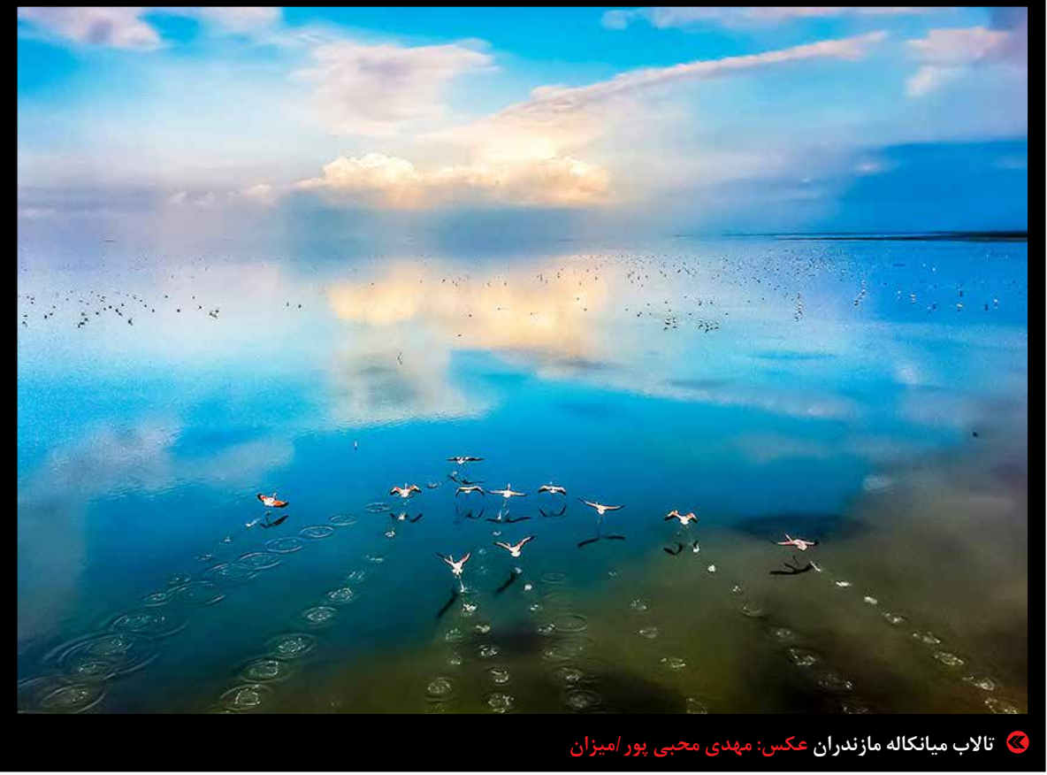
تالاب میانکاله مازندران

درحال حاضر بازار خودروهای ایرانی و خارجی رکاد است و به‌رغم کاهش قیمت دلار اما باز هم خبری از خریدار نیست. درهمین رابطه کارشناسان بازار خودرو معتقدند که چنانچه روند مذاکرات مثبت باشد، پیش‌بینی می‌شود تداوم کاهش قیمت خودروهای داخلی ادامه‌دار باشد، اما در بازار خودروهای وارداتی نمی‌توان چندان به‌کاهش قیمت یا بهبود اوضاع امیدوار بود. درحالی که