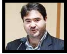
محمد رضا خضریان کاشانی کارشناس علوم سیاسی

شبهه و در نشست جی ۲۰، «نارندرا مودی» نخست‌وزیر هند در پس زمینه یک ماکت دقیق از چرخ کنارک (Konark) طی سخنرانی‌اش بر این نام بردن از کشورش به‌جای کلمه انگلیسی هند (India) از نام باستانی «بهارات» استفاده کرد. روی پلاک مقابل او نیز به جای هند از واژه «بهارات» استفاده شد. در نشان رسمی نشست گروه ۲۰ هم به انگلیسی هند و به زبان هندی، بهارات نوشته شده بود. در حالیکه تا پیش از این تنها از واژه هند استفاده می‌شد. «بهارات»، «بهاراتا» و «هندوستان» نام‌های پیش از دوران استعمار هستند که عامه مردم در زندگی روزمره خود از آن‌ها استفاده می‌کنند اما در مراودات و مکاتبات رسمی دولتی عموماً تاکنون از واژه هند استفاده می‌شده است. دولت هند اعلام کرده بزودی لایحه ای برای تغییر رسمی نام این کشور به «بهارات» به پارلمان ارائه خواهد کرد.