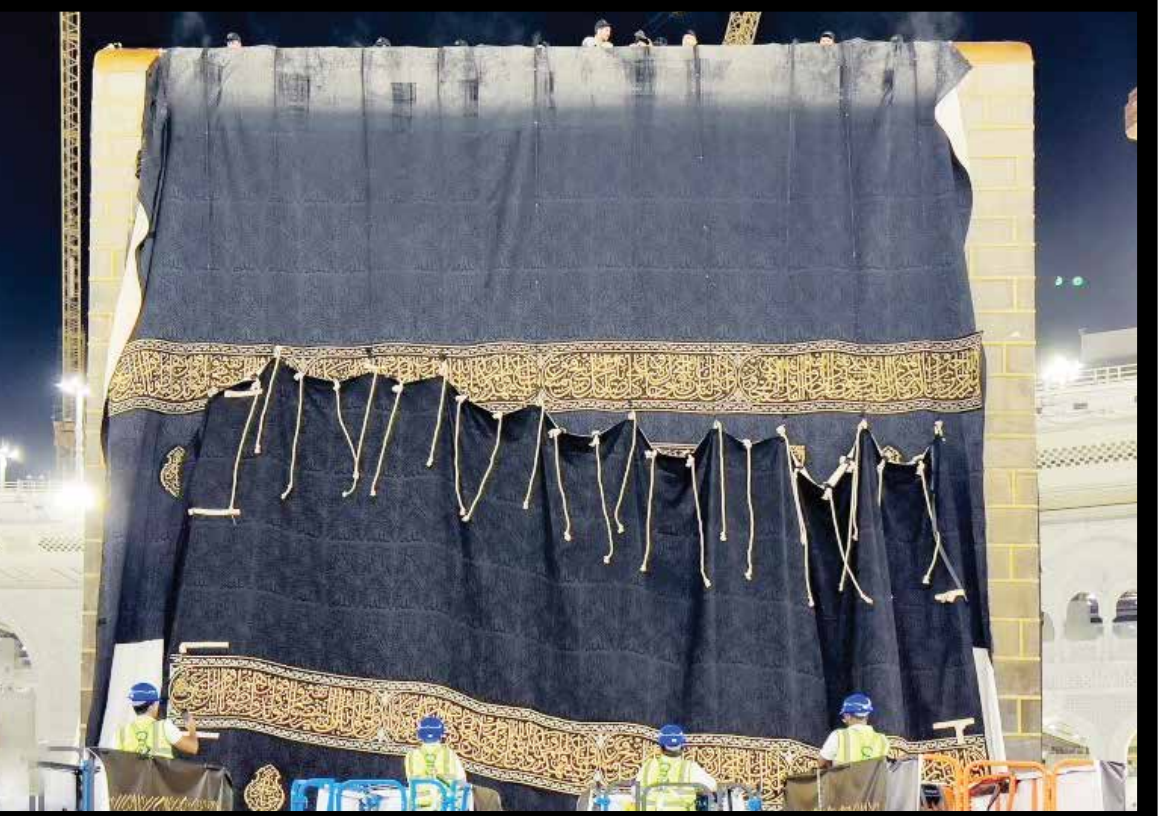
← تعویض پرده کعبه

اداره ارتباطات و اطلاع رسانی بنادر و دریانوردی استان هرمزگان