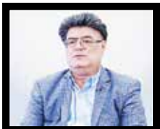
آلبرت بزازیان اقتصاددان

اصولا در تنش های نظامی و سیاسی شاهد واکنش های سریع و هیجانی بازارها نسبت به وقایع اتفاق رخ داده و روندهای هستیم که در پیش روست آنچه در بازار طلا و ارز بخصوص بعد از تنش های نظامی بین ایران و رژیم صهیونیستی و انتخاب دوباره دونالد ترامپ برای ریاست جمهوری آمریکا رخ داد ناشی از واکنش هایی است که بازار به تنش های نظامی و سیاسی نشان می دهد.