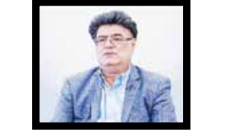
آلبرت یغزبان اقتصاددان

بهره‌وری و بهبود اقتصاد حاصل تغییر رویکردهای مدیریتی