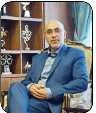
سرپرست اداره کل مطبوعات و خیرگزاری‌های داخلی:

گفتنی است این افزایش سرمایه بر اساس تصمیمات مجمع عمومی فوق‌العاده مورخ ۱۸ آذر ۱۴۰۲ از سوی سهامداران مصوب شده بود. افزایش سرمایه ۱۰۰ درصدی بر اساس اهداف اصلاح در ساختار مالی، بهبود نسبت کفایت سرمایه و افزایش و توسعه خدمات بانکی انجام شد. لازم به یادآوری است پیشنهاد افزایش سرمایه ۵۶۷ درصدی بانک گردشگری از مبلغ ۳۰ هزار میلیارد ریال به مبلغ ۲۰۰ هزار میلیارد ریال نیز در آبان ۱۴۰۳ به تصویب هیات مدیره این بانک رسیده است.