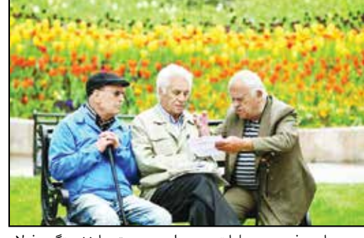
معاون فنی و عملیات بیمه ای صندوق بازنشستگی فولاد ضمن اعلام آغاز صدور احکام متناسب سازی، از پرداخت مبالغ