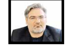
رحمان سعادت اقتصاددان

افزایش تورم را می توان دغدغه ای بسیار نگران کننده یا یکی از مهمترین دغدغه های مردم ایران عنوان کرد زیرا در طی دهه های گذشته تا کنون همواره تورم نقشی مخربی در زندگی و معیشت آنها داشته است بنابراین کاهش تورم و فائق آمدن بر آنچه زمینه ساز افزایش تورم می شود یکی از اصلی ترین دغدغه های مردم به شمار می رود. آنچه در این زمینه حائز اهمیت است و نباید آن را از نظر دور داشت موضوع افزایش نرخ ارز بر بالا رفتن نرخ تورم است. تورم بالا از این جهت نگران کننده است زیرا قدرت خرید مردم را کاهش داده یا در برخی طبقات از بین می برد بنابراین این مقوله با این مثلث در کنار هم هر یک ضلعی دارند که مهم و با هم مرتبط است لذا مسوولین امر باید توجه جدی به این موارد داشته باشند. ارتقای قدرت خرید مردم با تقویت ارزش پول ملی در ارتباط است نمی توان منکر این موضوع شد که کاهش یا از دست رفتن ارزش پول ملی توجیهی برای سفته بازی، عدم هدایت سرمایه ها به سمت فعالیت های تولیدی، افزایش تقاضای ارزی و به تبع این فرایند کاهش قدرت خرید مردم و افزایش تورم شده است. این چرخه نابود کننده اقتصاد و آسیب رسان به بخش مولد ما را از توسعه باز می دارد ضمن اینکه تبعات بسیار زیادی بر فعالیت های تولیدی و به تبع آن ازآوری کشور وارد می کند به این دلایل بسیار مهم راهکارهای کاهش نرخ تورم، کاهش نرخ ارز و تقویت قدرت پول ملی برای برون رفت و توسعه اقتصادی کشور و تقویت سفرایری در با دقت و حساسیت و نظارت بسیار جدی مورد توجه مسوولین قرار بگیرد زیرا امنیت داخلی و عدم دورخیز دشمن برای تحمیل فشارهای بیشتر اقتصادی بر ما و اهدار عبور از بحران های اقتصادی و معیشتی و جلب رضایت مردم است.